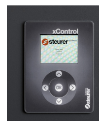
Unité de commande xControl