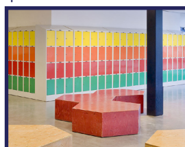
Casiers et système d'armoires