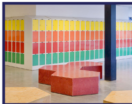
Lockers en kastsystemen