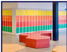
Lockers en kastsystemen